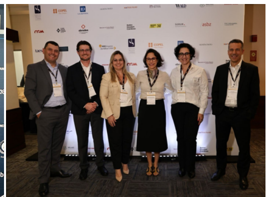
XXX Simpósio Jurídico ABCE