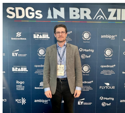
Evento SDGs in Brazil na Climate Week NYC 2024